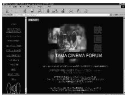
TAMA映画フォーラムホームページアドレス http://www02.so-net.ne.jp/~tamaeiga

私たちの活動を、広く皆さんに知っていただくために、TAMA映画フォーラムでは、インターネットによる情報発信を行っています。このホームページでは、映画祭情報は勿論、フォーラム・メンバーが最近観たお勧めの映画や、定期的開催している自主制作映画上映会のお知らせ、皆さんが自由に書き込める電子掲示板といった様々な情報を提供しています。