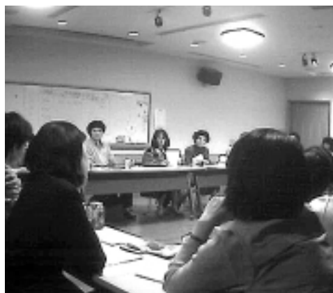
実行委員会でのミーティング風景 (ベルブ永山にて隔週日曜午後6時より開催)

このTAMA映画フォーラムは「映画」というものをきっかけとした「市民の広場」として発足し、世代・