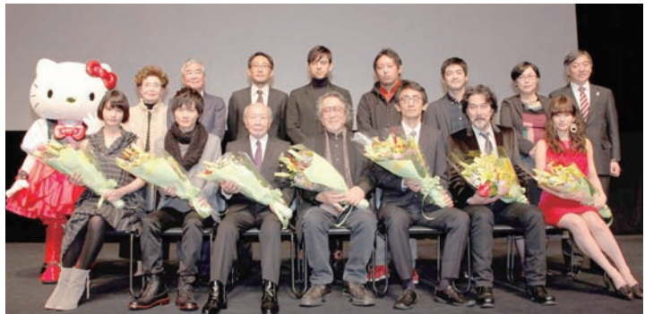
昨年(第4回)TAMA映画賞受賞者の皆さん

多摩市及び近郊の市民からなる実行委員が「明日への元気を与えてくれる・夢をみせてくれる活力溢れるくいきのいい」作品・監督・俳優を、映画ファンの立場から感謝をこめて表彰いたします。